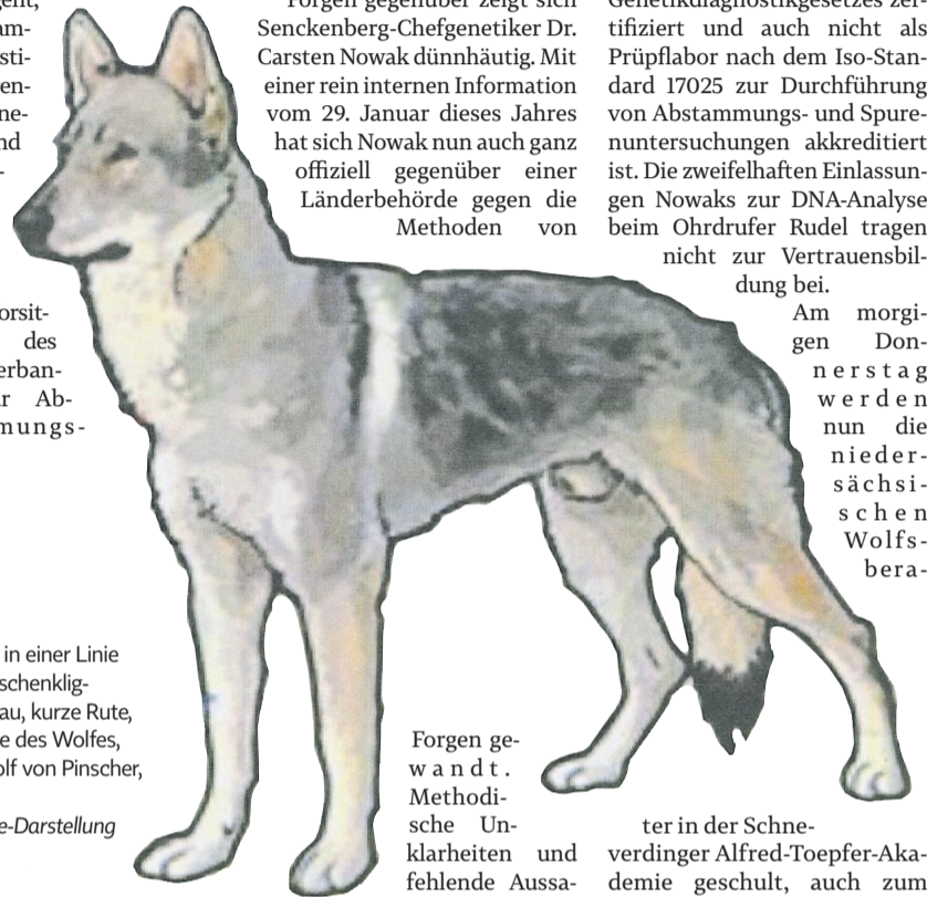
Forgen gewandt. Methodische Unklarheiten und fehlende Aussagekraft, so der Ablehnungsgrund von Forgen-Befunden.

Ein Institut, das ebenfalls nicht nur mitochondriale DNA, sondern vor allem Kern-DNA untersucht und über eine umfassende forensische Untersuchung Genmaterialien und weiteren vorhandenen Informationen auf den Grund geht, ist das Hamburger Institut für forensische Genetik und Rechtsmedizin Forgen. Forgen der Forensikerin und Vorsitzenden des Bundesverbandes für Abstammungs-